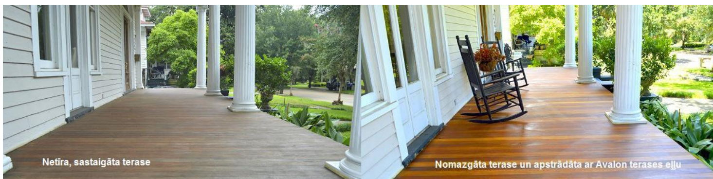
Netīra, sastaigāta terase